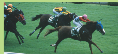
朱鹭夏季短途锦标赛