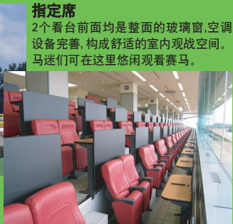
指定席 2个看台前面均是整面的玻璃窗,空调设备完善,构成舒适的室内观战空间。马迷们可在这里悠闲观看赛马。