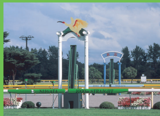
终点 终点标志上装饰着新潟的县鸟朱鹭。